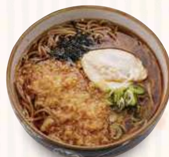
たぬたまそば 800円(税込)