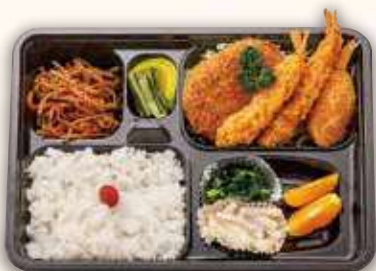
ミックスフライ弁当 1,000円(税込)