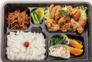
から揚げ弁当 1,000円(税込)