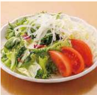
パリシャキサラダ 大《3人前》 700円(税込)