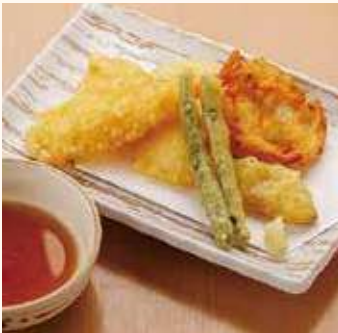
天ぷら 盛り合わせ 650円(税込)