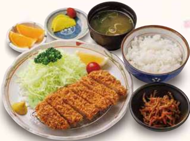
とんかつ御膳 1,300円(税込) 低温熟成ポークを使用しています