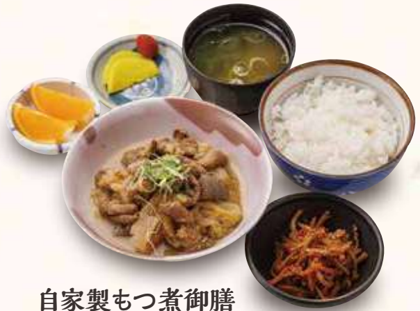
自家製もつ煮御膳 1,300円(税込) 信州白こし味噌を使用しています