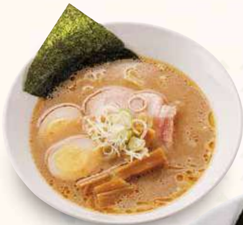
豚骨醤油ラーメン 800円(税込)