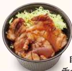
ミニ 自家製炙り チャーシュー井 650円(税込)