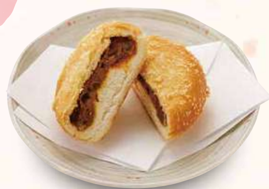
カレーパン 400円(税込)