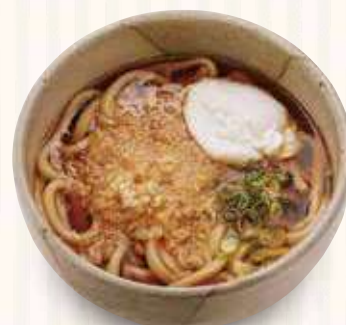
たぬたまうどん 800円(税込)