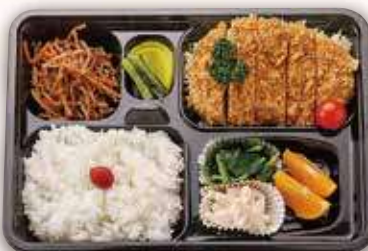
とんかつ弁当 1,000円(税込)