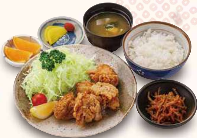
から揚げ御膳 1,300円(税込)