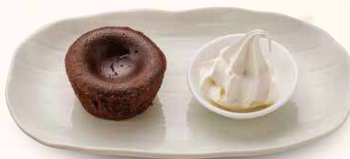
フォンダンショコラ 600円(税込)