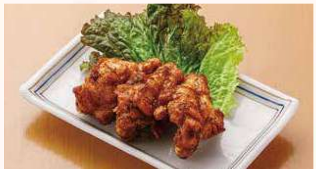
手羽元黒胡椒焼き 650円(税込)