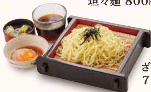
ざるラーメン 750円(税込)