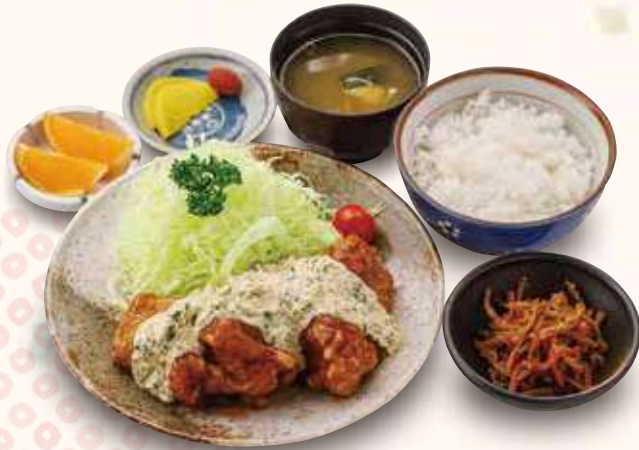
チキン南蛮御膳 1,300円(税込) 自家製野沢菜タルタルソースを使用しています