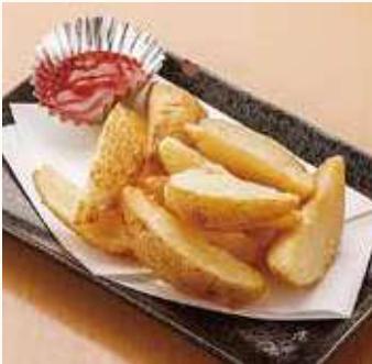
フライドポテト 500円(税込)