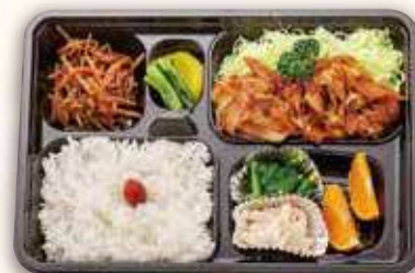
信州ポークの生姜焼き弁当 1,000円(税込)