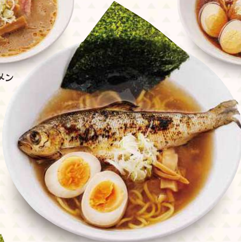
シナノユキマス塩ラーメン 1,200円(税込)