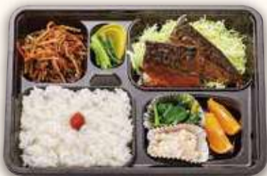
さば味噌煮弁当 1,000円(税込)