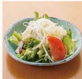
パリシャキサラダ 小《1人前》 400円(税込)