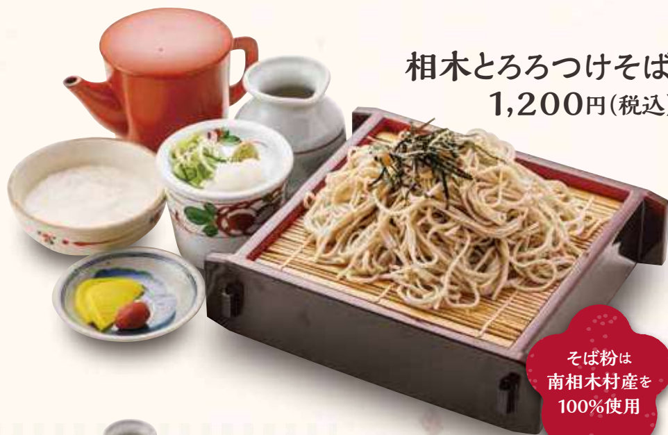
相木とろろつけそば 1,200円(税込)