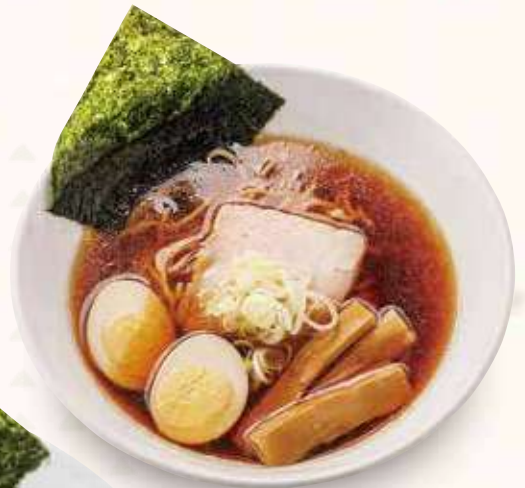
醤油ラーメン 800円(税込)