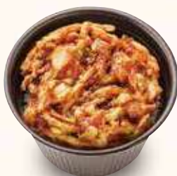
ミニかき揚げ井 600円(税込)