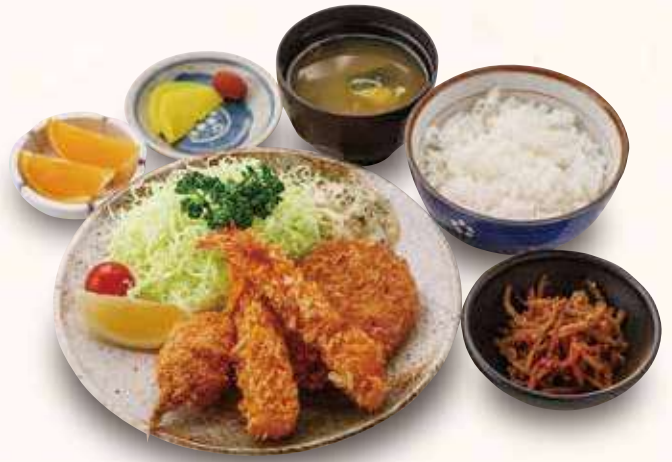
ミックスフライ御膳 1,300円(税込) エビフライ、カニクリームコロッケ、コロッケの3種フライ御膳です