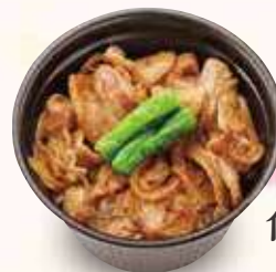
ミニ 信州ポークの 味噌豚井 600円(税込)