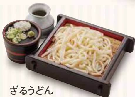
ざるうどん 700円(税込)