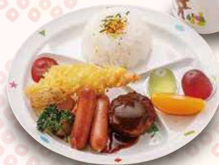
お子様ランチ 650円(税込)