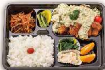
チキン南蛮弁当 1,000円(税込)