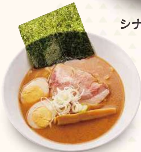
味噌ラーメン 800円(税込)