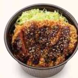
ミニソースかつ井 600円(税込)