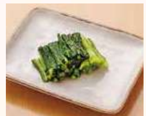
野沢菜漬け・小 1人前…200円(税込)