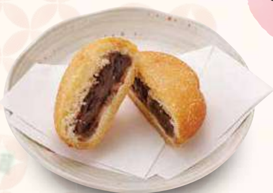
揚げあんドーナツ 400円(税込)