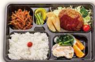
ハンバーグ弁当 1,000円(税込)