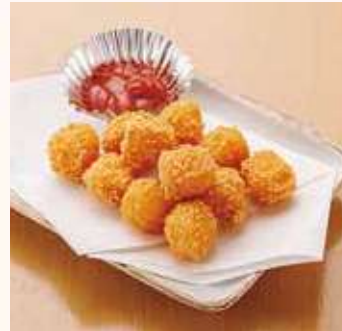
チーズ カリカリ揚げ 500円(税込)