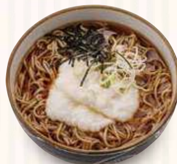
とろろかけそば 850円(税込)