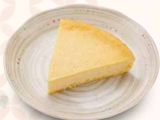
チーズケーキ 600円(税込)