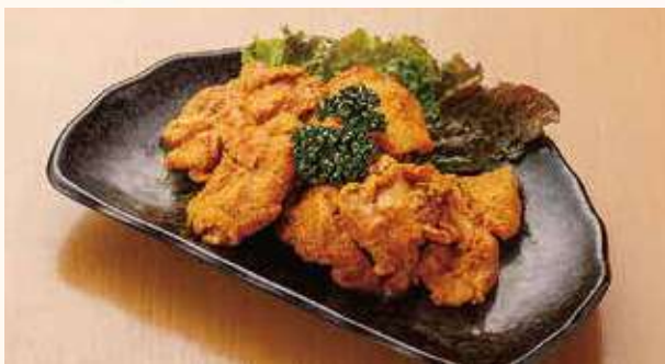
タンドリーチキン 650円(税込)