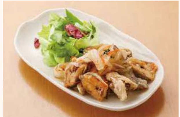
信州産シナノユキマスの南蛮漬け 700円(税込)