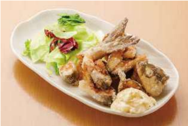
信州産シナノユキマスのカリカリ揚げ 700円(税込)