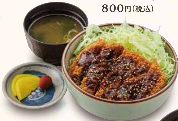
ソースかつ丼 800円(税込)