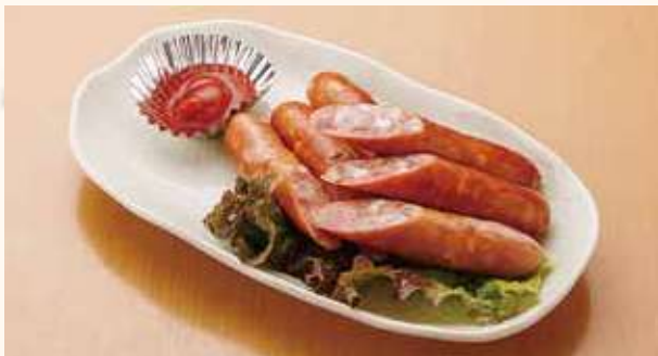
チーズ入りソーセージ 650円(税込)