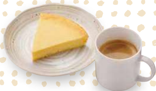
チーズケーキ+南相木ブレンドコーヒー