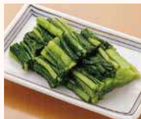
野沢菜漬け・大 3人前…400円(税込)