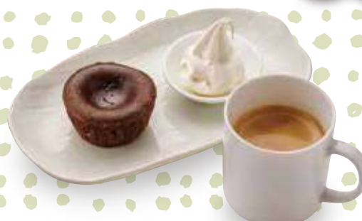
フォンダンショコラ+南相木ブレンドコーヒー